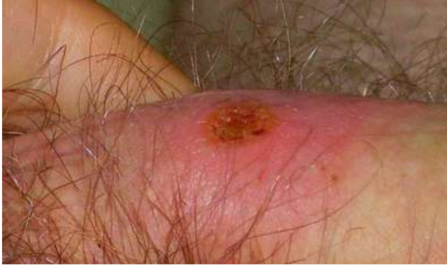
Obr. 1: Prvotní vřed na mužském genitálu

http://commons.wikimedia.org/wiki/File:Ulcus-durum-am-Penis-01.jpg