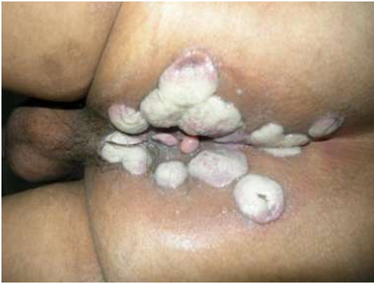
Obr. 3: Condylomata lata

http://www.vgrd.org/archive/cases/2011/syp/syp.html