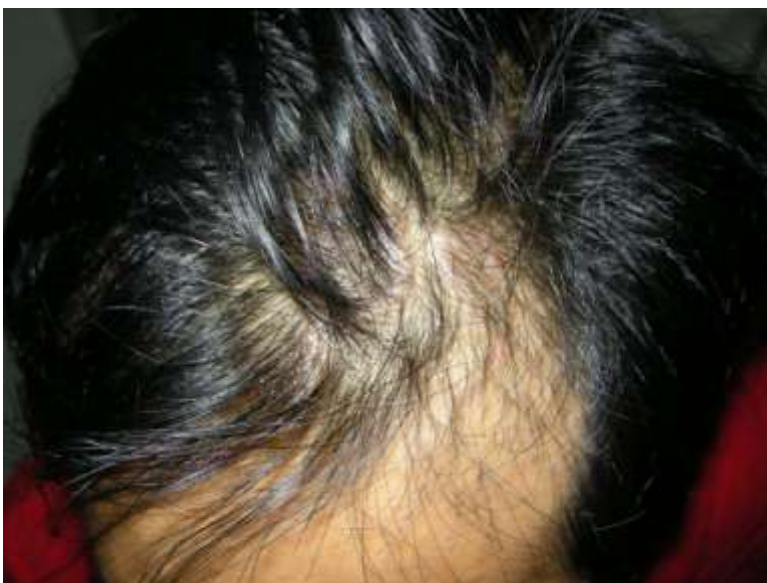
Obr. 2: Vypadávání vlasů

http://www.vgrd.org/archive/cases/2011/syp/syp.html