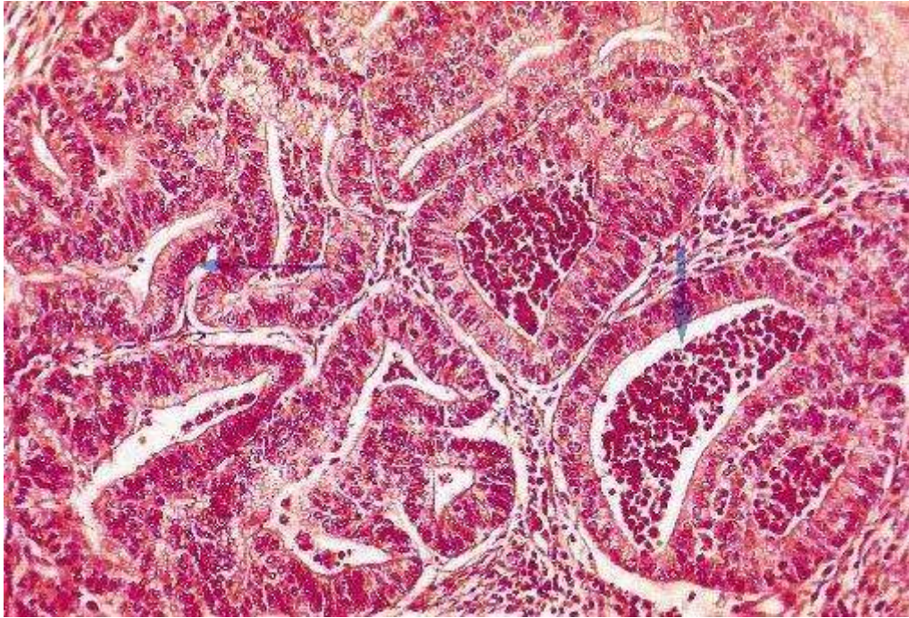
Obr. 2: Karcinom endometria – histologický vzorek (histologie = vyšetření buněk)

Zdroj: http://zdravi.e15.cz/clanek/priloha-lekarske-listy/zhoubne-nadory-delozniho-tela-144700 , Zhoubné nádory děložního těla - Příloha Lékařských listů 18/2002 (ze dne 1. 4. 2014)