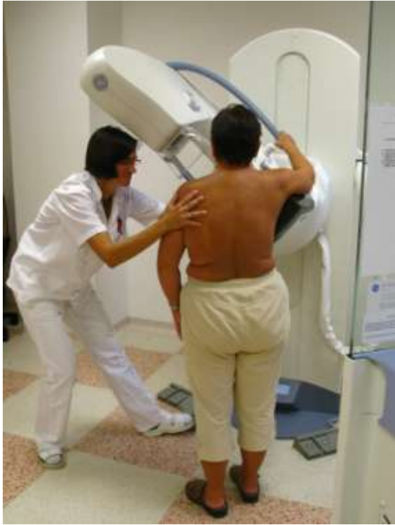
Obr. 1 Laborantka provádí polohování před snímkováním mamografem.